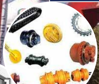
Accessoires de rechange et pièces détachées