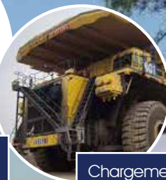
Chargement de camions