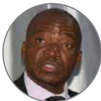
Isaac Kwesu Président de l'Association de l'Industrie Minière d'Afrique Australe, Zimbabwe