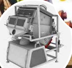
Machines de criblage