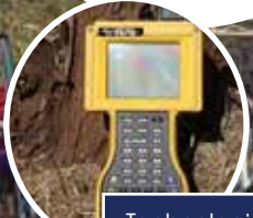
Technologies de relevé / mesure