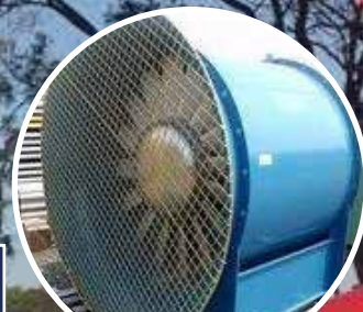
Ventilateurs / Refrigidisateurs d'air