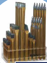
Rouleaux de coupe et burins